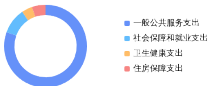
一般公共预算财政拨款支出决算结构情况

2024 年度一般公共预算财政拨款支出 1010.7 万元，主要用于以下方面：一般公共服务支出 813.7 万元，占 80.5%；社会保障和就业支出 101.2 万元，占 10%；卫生健康支出 41.9 万元，占 4.1%；住房保障支出 53.9 万元，占 5.3%。