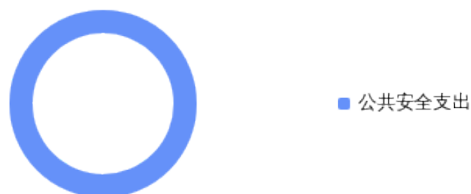
一般公共预算财政拨款支出决算结构情况

2024 年度一般公共预算财政拨款支出 234.3 万元，主要用于以下方面：公共安全支出支出 234.3 万元，占 100%。