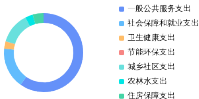
一般公共预算财政拨款支出决算结构情况

2024 年度一般公共预算财政拨款支出 769.4 万元，主要用于以下方面：一般公共服务支出支出 460.5 万元，占 59.9%；社会保障和就业支出支出 128.8 万元，占 16.7%；卫生健康支出支出 23.1 万元，占 3%；节能环保支出支出 0.3 万元，占 0%；城乡社区支出支出 98.5 万元，占 12.8%；农林水支出支出 24.1 万元，占 3.1%；住房保障支出支出 34.1 万元，占 4.4%。